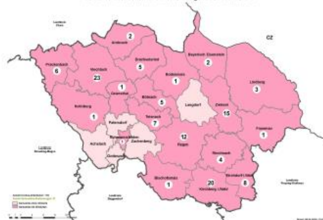
COVID-19-Infektionen im Landkreis Regen nach Wohnorten

Im Landkreis Regen: 118 (davon 97 genesen, 13 sind in den Kliniken zur Behandlung) In der Gemeinde Teisnoach: 7